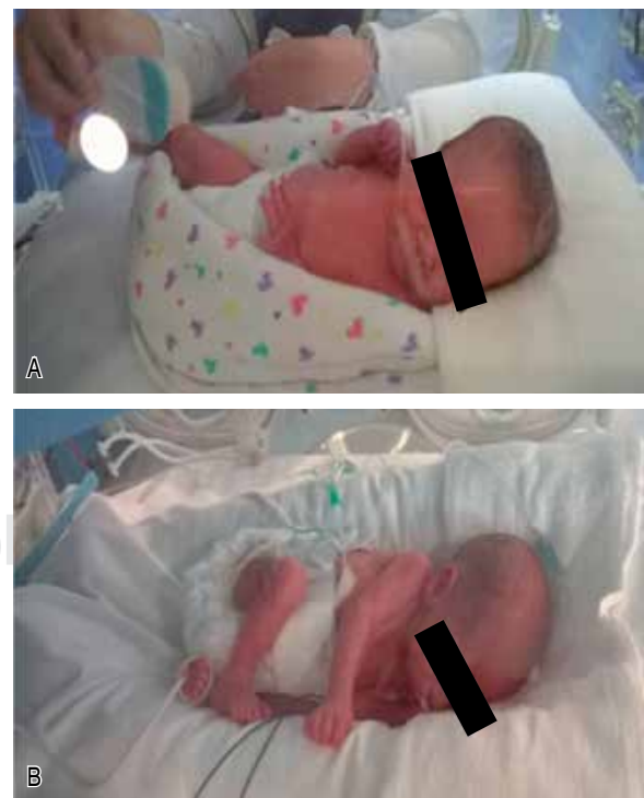
Figura 1. Métodos de contención. A. Neonato en método de contención «Snuggle Up Phillips®». B. Neonato en método de contención «Nido Nantli®».

Estudio prospectivo, longitudinal, que incluyó neonatos pretérmino de edad gestacional igual o menor a 32 semanas o con peso menor o igual a 2,500 gramos al nacimiento, atendidos en la UCIN del Hospital Español de México entre julio de 2015 y noviembre de 2016. Los neonatos fueron asignados de manera no aleatoria a tres grupos diferentes: 1) contención mediante uteroposicionador marca Snuggle Up Phillips®, 2) contención mediante nido neonatal marca Nantli® y 3) sin método de contención (Figura 1). Se